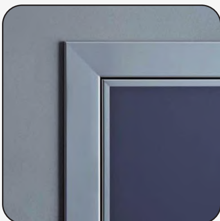
Bordatura anta con profilo in alluminio estruso