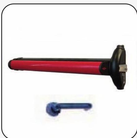
Maniglione push-bar antipanico interno e maniglia esterna