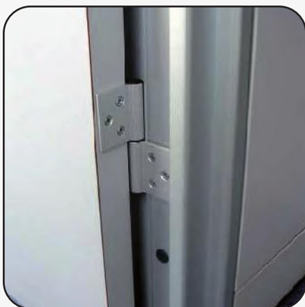
Cerniera su telaio in alluminio