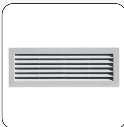
Griglia di areazione