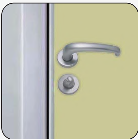
Maniglia con nottolino WC