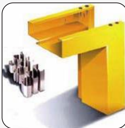
Telaio in lamiera di acciaio laccato