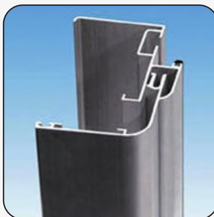
Telaio con profili in alluminio estruso